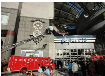
『DOG×POLICE 純白の絆』 (2011 年公開)

広島フィルム・コミッションでは、広島での映画やテレビドラマ、コマーシャルフィルム等のロケーション撮影の誘致や支援を行っており、撮影件数の累計は約 3,000 件、海外案件は 400 件を数えます。この度、その支援作品のポスター、普段は目にすることのない撮影時のシナリオや限定グッズ（非売品）など、また中央図書館が所蔵する支援作品の原作本や関連資料も展示します。