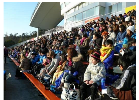
韓国映画『裸足の夢』 (2010 年公開)