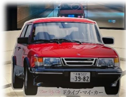
『ドライブ・マイ・カー』 (2021 年公開)