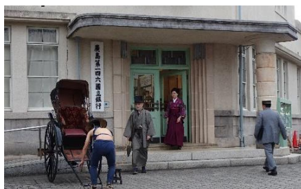
『吟ずる者たち』 (2021 年公開)